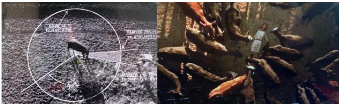
Fig. 3– Comunicazione con il mondo animale di Temple Grandin ( Temple Grandin , Mick Jackson 2010).

A questo proposito, è importante osservare le strategie enunciative che il film mette in campo al fine di rappresentare l'esperienza della protagonista. Il colpo d'occhio del "genio", plasmato dall'autismo, assume i tratti dell'osservazione geometrica, che permette a un essere umano speciale di vedere come nessun altro essere umano vede: alla visione folgorante di Nash, data dalla schizofrenia, si sostituisce qui l'indagine schematizzante dello sguardo autistico, stereotipicamente tematizzato come caratterizzato da una tendenza sistematizzante, una focalizzazione sui dettagli e una preferenza per pattern ripetitivi (Baron-Cohen 2020). D'altro canto, è ancora una volta questa possibilità di entrare in contatto con il mondo non umano che consentirà a Temple Grandin, nel corso del film, di essere accolta e riconosciuta nel regno antropico culturale e nell'universo professionale (fig.3).